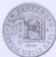
rovescio | reverse