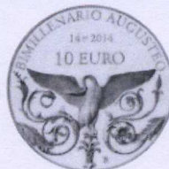
rovescio | reverse