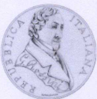
dritto | obverse

Compositori europei European composers Europe Star Programme series