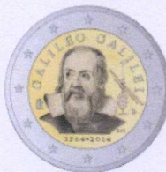
diritto | obverse

INCLUDED IN THE ANNUAL COIN SETS 9 AND 10 PCS