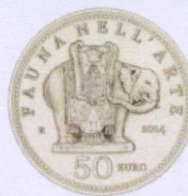
rovescio | reverse