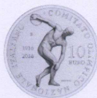
rovescio | reverse