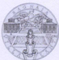
rovescio | reverse