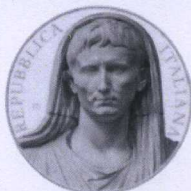
dritto | obverse

"Bimillenary of the death of Augustus (14 - 2014)" (2)