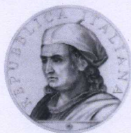
dritto | obverse

“500 th Anniversary of the death of Donato Bramante (1514 - 2014)”