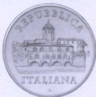
dritto | obverse

Serie Italia delle Arti Italy of Arts series