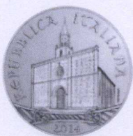
dritto | obverse

Serie Italia delle Arti Italy of Arts series