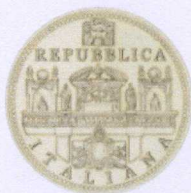
dritto | obverse