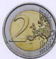
rovescio | reverse