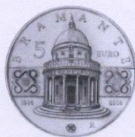
rovescio | reverse