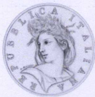
dritto | obverse

“Italian Presidency of the Council of the European Union”