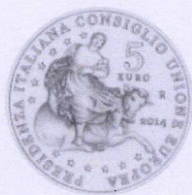
rovescio | reverse