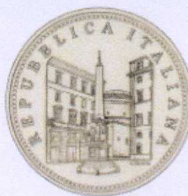
diritto | obverse

Serie Fauna nell’Arte Fauna in Art series