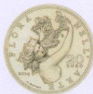
rovescio | reverse