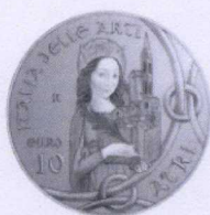
rovescio | reverse