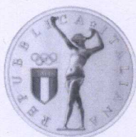
dritto | obverse

"100 th Anniversary of the foundation of the Italian Olympic Committee (1914 - 2014)" (3)