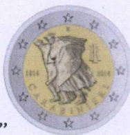
diritto | obverse