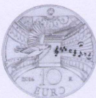
rovescio | reverse