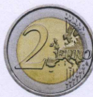
rovescio | reverse