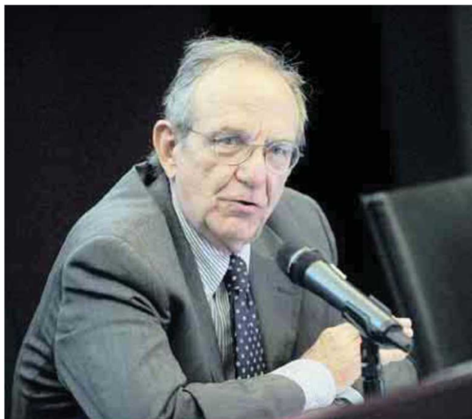
Il ministro dell'Economia, Padoa