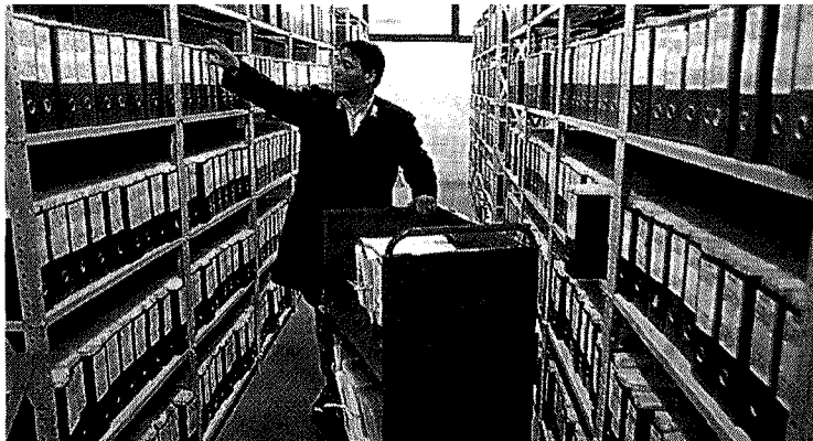
Semplificazioni in arrivo per la pubblica amministrazione