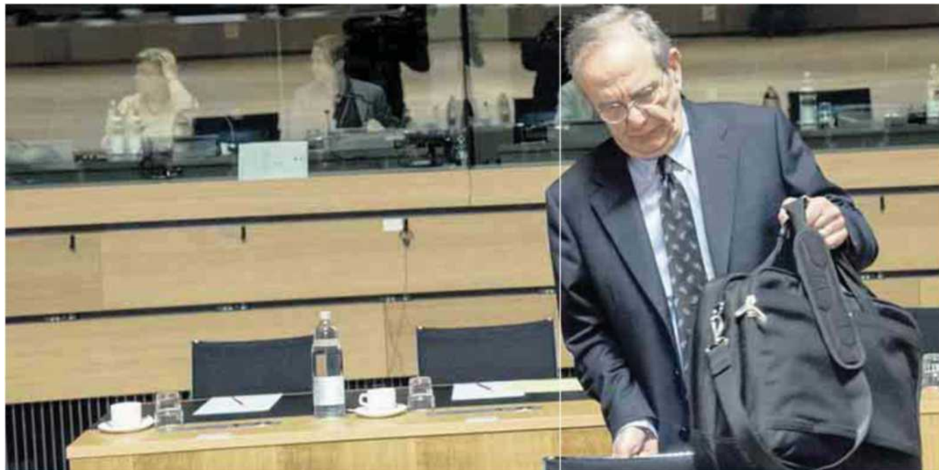
Il ministro dell'Economia Pier Carlo Padoa