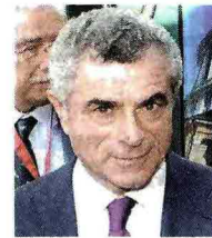
Mauro Moretti Amministratore di Ferrovie