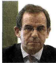
Gorno Tempini Guida la Cassa Depositi e Prestiti