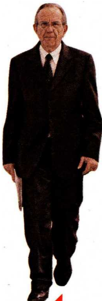
AL TIMONE Il ministro dell'Economia, Pier Carlo Padoan